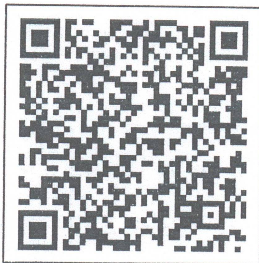
สแกน QR-Code เพื่อสมัครเข้าประกวด